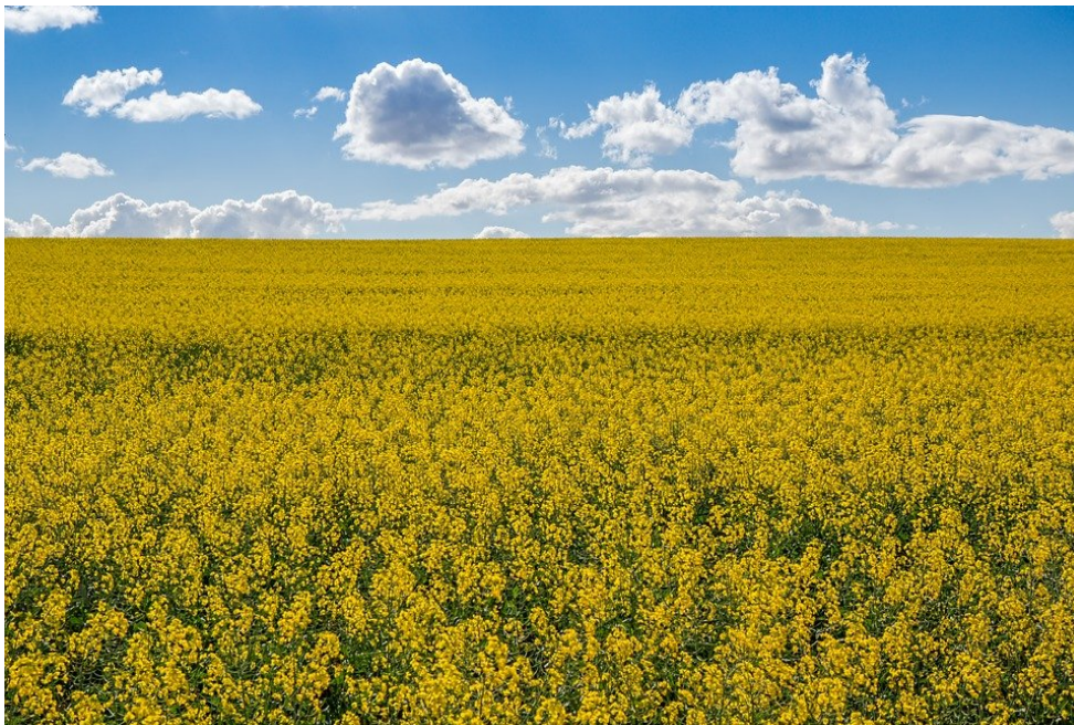
Campo di colza, utilizzata per produrre biodiesel.